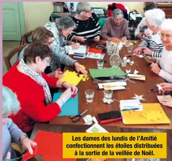
Les dames des lundis de l'Amitié confectionnent les étoiles distribuées à la sortie de la veillée de Noël.