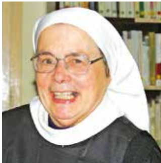
Par Sœur Claire