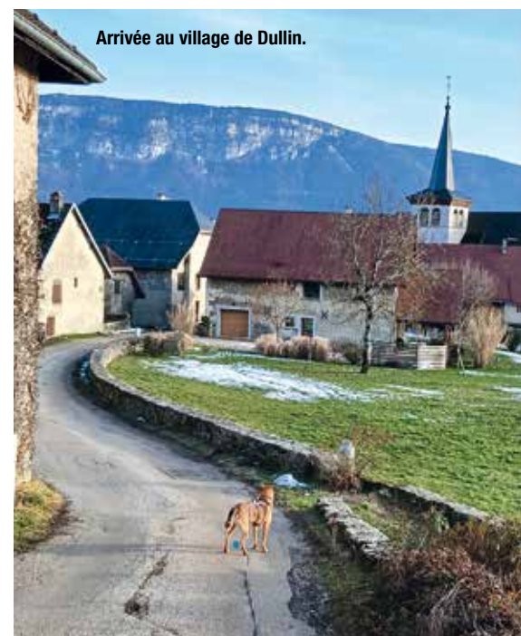
Arrivée au village de Dullin.

Pour conclure, nous invitons chaque lecteur à découvrir l'activité de l'association sur le site chemindassise.org et l'histoire de saint François d'Assise.