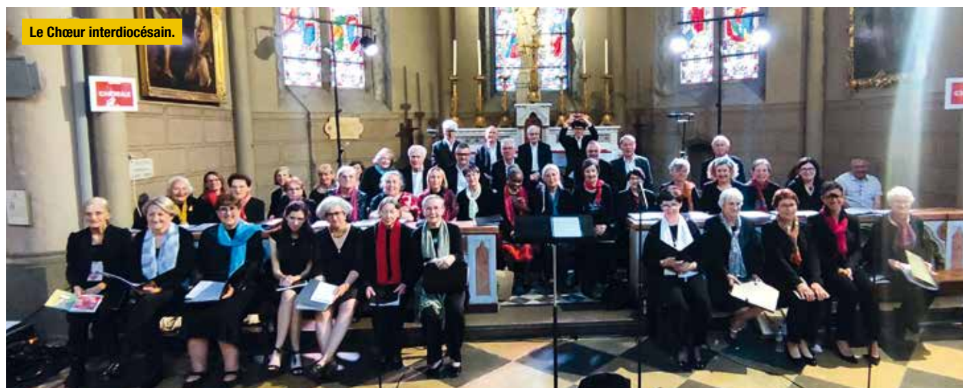
Le Chœur interdiocésain.

Renseignements et inscriptions auprès du service diocésain de musique : choeurinterdiocesain@catholique73.org