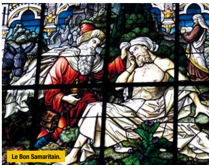
Le Bon Samaritain.