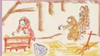
Avec les bergers.