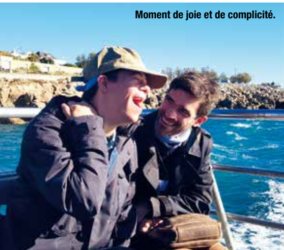
Moment de joie et de complicité.