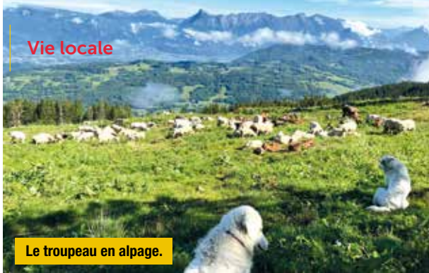
Le troupeau en alpage.

manche matin, toujours à Novalaise. Début 2026, nouvelle facette du Gaec, avec l'ouverture d'un magasin de vente au cœur du village; ce lieu permet plus de temps de présence puisque le magasin est ouvert le mardi toute la journée, le mercredi après-midi, le jeudi matin, le vendredi toute la journée et le samedi après midi; cela s'ajoute aux marchés des mercredi, samedi et dimanche matin. Mais, comme le dit Marie-Clotilde, quel confort d'avoir son propre magasin, tout en continuant les différents marchés hebdomadaires.