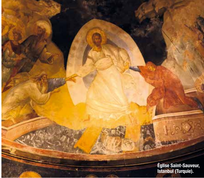
Église Saint-Sauveur, Istanbul (Turquie).