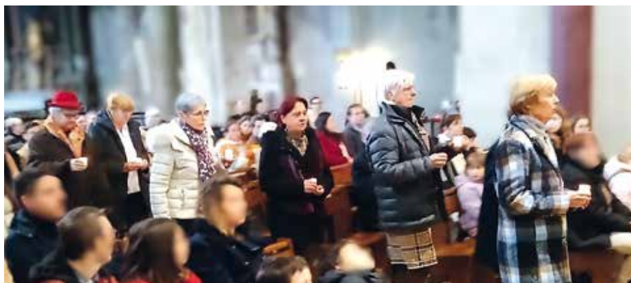
Le 8 février, à l'occasion du dimanche de la santé, l'équipe de la pastorale de la santé va déposer la lumière devant l'autel, signe des prières pour les personnes visitées.

N otre communauté porte le souci de ses membres isolés par la maladie, la vieillesse, le handicap ou la solitude. La Pastorale de la santé, c'est être une présence aimante et réconfortante, au nom du Christ, et être témoin de son amour pour tous les hommes. Sa mission dans le milieu hospitalier ou en maison de retraite, c'est :