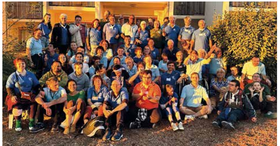
Voyage à Sète.