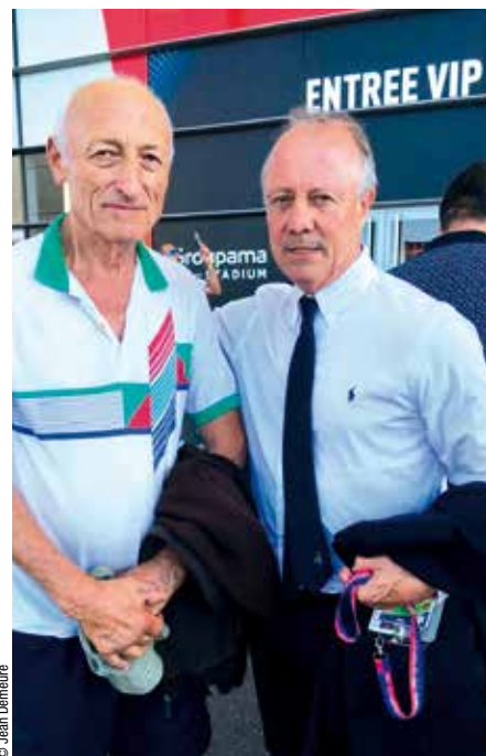
Bernard Lacombe (à droite) avec un supporter de la première heure.