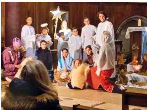
Les acteurs du conte.