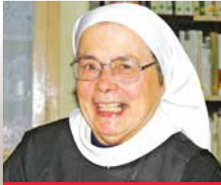
Par Sœur Claire de l'abbaye de La Rochette