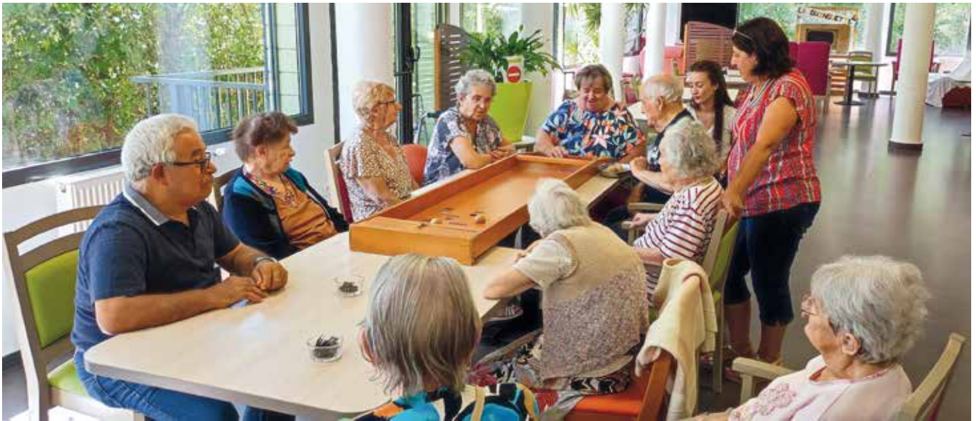
Après-midi jeux avec les résidents de Pont et Saint-Genix.

fessions en rapport avec les personnes âgées, alors que depuis plusieurs années, le directeur s'efforce de mettre en avant auprès des salariés et des familles des valeurs fondamentales, telles que la solidarité, le respect, la citoyenneté et l'universalité.