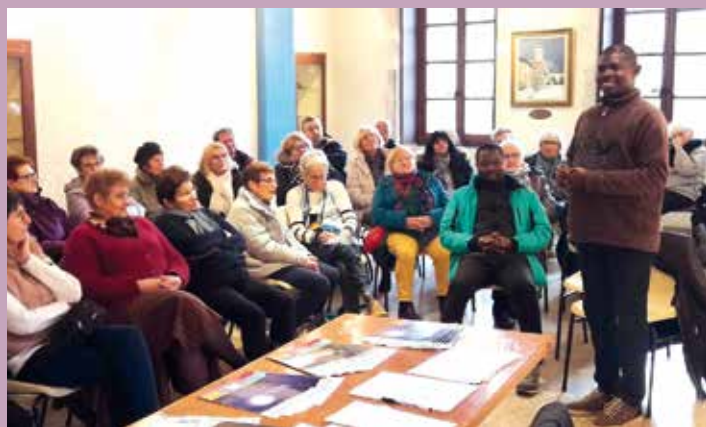
Les diffuseurs rassemblés à la salle capitulaire.