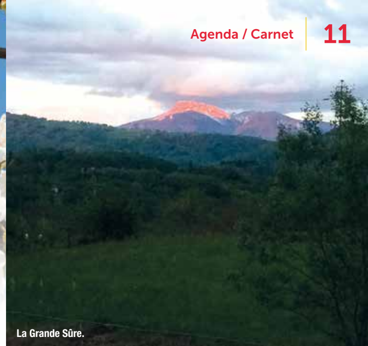
La Grande Sûre.