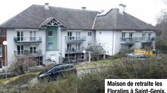
Maison de retraite les Floralies à Saint-Genix.