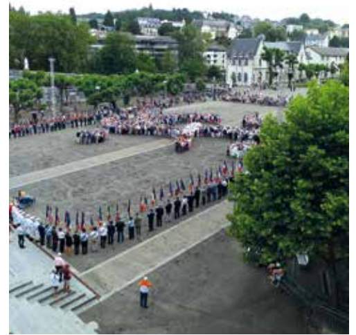
Toute l'année, de nombreux groupes de pèlerins viennent à Lourdes prier la Vierge Marie, comme ici celui de la FNACA.

cierges innombrables qui brûlent et illuminent le sanctuaire jour et nuit portés par des personnes de toutes les langues du monde, la procession de nuit aux flambeaux qui apporte la paix et la joie dans les cœurs, tout cela est une expérience forte et inoubliable.