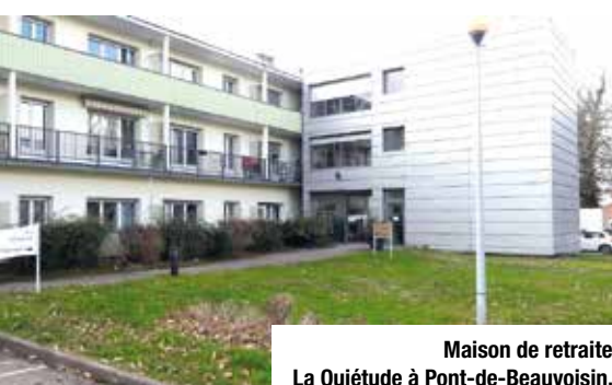
Maison de retraite La Quiétude à Pont-de-Beauvoisin.

Les relations avec les familles sont bonnes. Cependant, quelquefois, les agents se heurtent au déni de certaines d'entre elles, qui refusent le vieillissement de leur proche et contestent son envie de se reposer ! Dans ces cas, le dialogue et la concertation sont nécessaires pour éviter des incompréhensions. La période des confinements du Covid a été difficile. Il a fallu, à la fois, respecter les règles de sécurité sanitaire et faire preuve d'humanité et de bon sens. De même, le livre-enquête Les fossoyeurs a fait beaucoup de mal : il a jeté le discrédit et la méfiance sur toutes les pro-