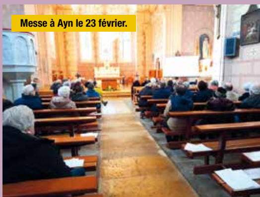
Messe à Ayn le 23 février.