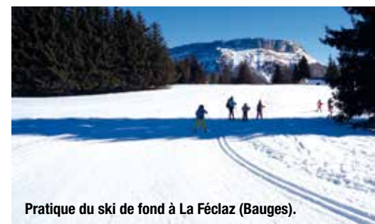
Pratique du ski de fond à La Féclaz (Bauges).

Plus d'informations sur le site internet : notredamenovalaise.toutemonecole.fr