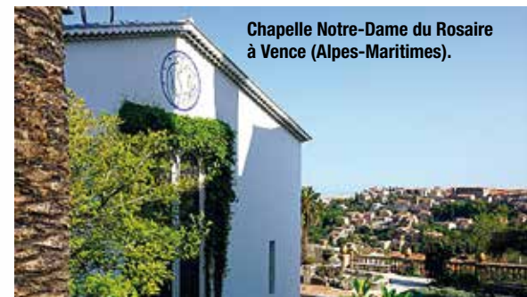
Chapelle Notre-Dame du Rosaire à Vence (Alpes-Maritimes).