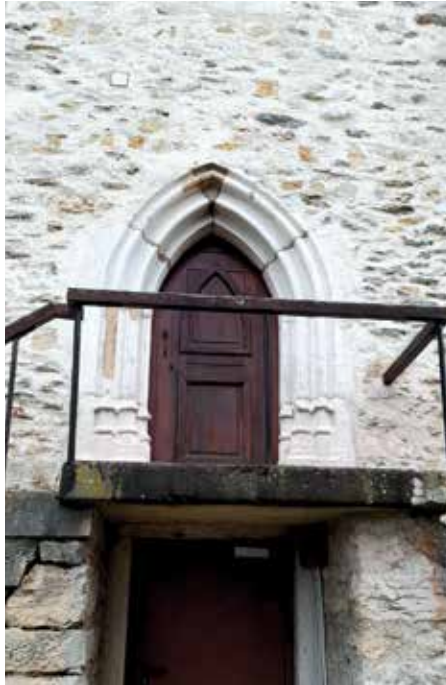
De la porte étroite (porte de la sacristie, église de Dullin)...

... à la grande porte (porte de l'ancienne étude notariale de Le Pont-de-Beauvoisin).