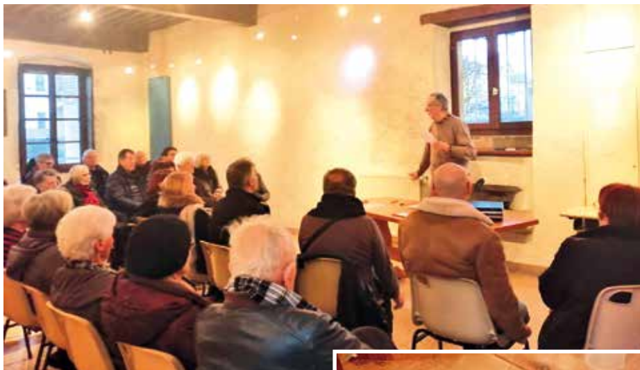
Les diffuseurs rassemblés à la salle capitulaire.