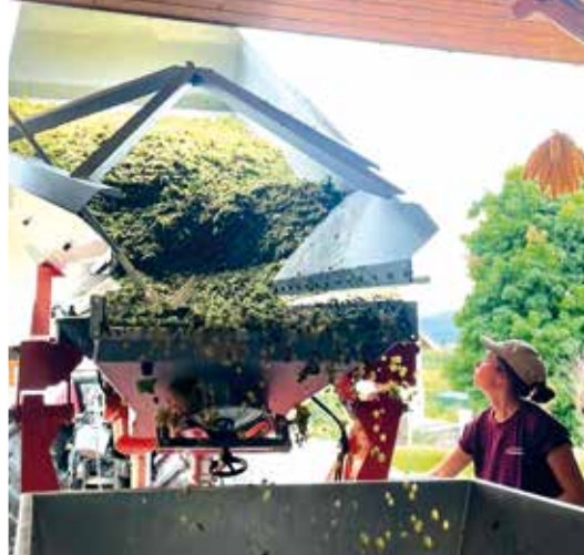
Avec modération !

« C'est une fierté de son travail effectué toute l'année, c'est quelque chose de valorisant, de concret : c'est quand on voit les cuves qui se remplissent à la cave qu'on prend conscience des belles choses que l'on a réalisées durant l'année. »