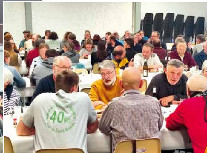
Le repas qui s'est suivi à Saint-Joseph-de-Rivière.